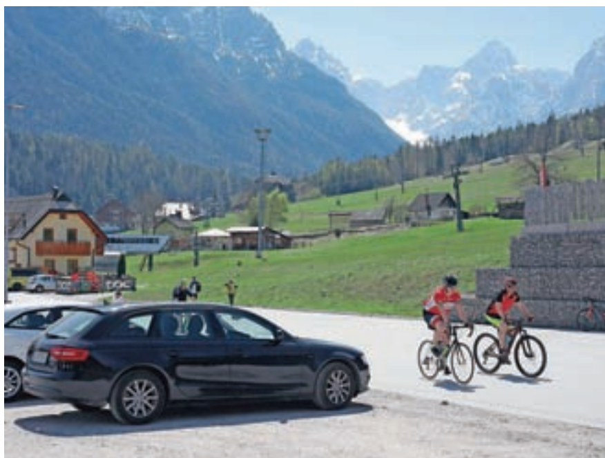
Poletna sezona na kranjskogorskih smučiščih se je že začela.

Sicer pa v teh dneh že začnajo s poletno sezono, ko gostom ponujajo obisk tematske poti Vitranc, kjer lahko na sedmih tematskih točkah, ki so postavljene od vznožja spodnje postaje sedežnice Vitranc do Bedančevega doma pri zgornji postaji sedežnice, s