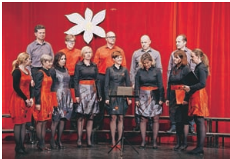
Triglavski zvonovi na letošnji območni reviji pevskih zborov

"Prav te pesmi, ki dedke in babice popeljejo nazaj v mladostne dni, v zadnjem času z velikim navdušenjem prepevamo pevke in pevci Triglavskih zvonov. S podoknicami bomo v celoto povezali naš tradicionalni, že dvajseti letni koncert, ki bo tokrat nekoliko drugačen in igrivo poleten. V nedeljo, 2. junija, ob 20. uri bomo v Aljaževem prosvetnem domu na Dovjem skupaj spoznali, kako preprosto lepa je bila včasih ljubezen in kako iznajdljivi so bili fantje, ki so za vsako ceno želeli očarati svoja muhasta dekleta," vabijo v svojo družbo.