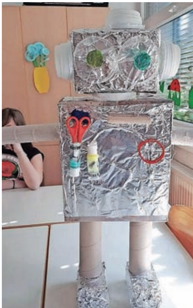
Zmagovalni izdelek delavnice ponovne uporabe, delo učencev četrtega in petega razreda

Organizatorji so učencem od 1. do 7. razreda najprej predstavili obe organizaciji in se z njimi pogovorili o ranljivosti in enkratnosti planeta, na katerem živimo. "Predstavili smo jim načine, ki pomagajo naš planet ohraniti zelen in čist, ter poudarili, kako pomembno je med drugim tudi ločevanje odpadkov. Nato so učenci po skupinah ustvarjali na temo Zemlja. Prvi razred se je preselil na športno igrišče, kjer so na pripravljeno platno v obliki Zemlje slikali svojo predstavo zelenega in čistega okolja. Učenci drugega in tretjega razreda so iz odpadnega papirja ustvarjali drevo v različnih letnih časih, četrto- in petošolci pa so se preizkusili v ponovni uporabi in iz odpadnega materiala izdelovali nove izdelke. Prepustili so se domišljiji in nastali so