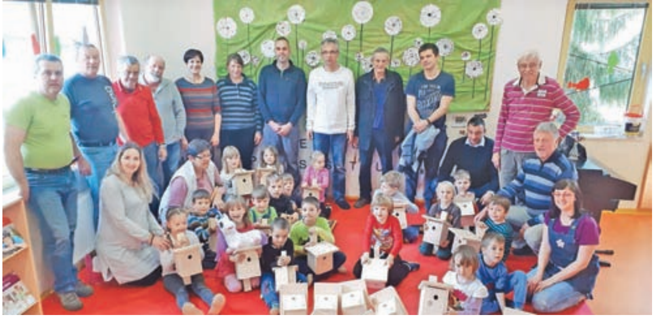
Aprila so otroci iz skupine Gamski skupaj z dedki izdelovali ptičje valilnice.