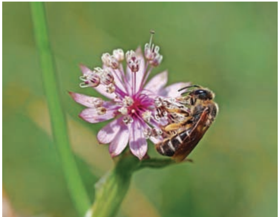
Čebela samotarka na cvetu zalega kobilčka

Odgovor nas bo osupnil! Ko spomladi ob poti čez travnik opazujemo cvetove različnih vrst rastlin in obiskovalce na njih, vidimo čebelice različnih velikosti in barv ter vmes kakšnega čmrlja. Vsi živahno zbirajo cvetni prah in medicino za hrano svojega potomstva. Ker pa je narava Slovenije zelo raznolika, je raznolika tudi rastlinstvo, druge vrste rastejo ob morju