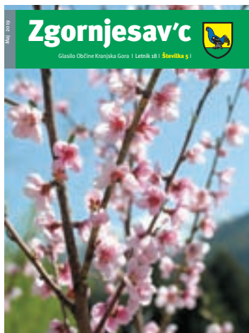
Na naslovnici: Pomlad