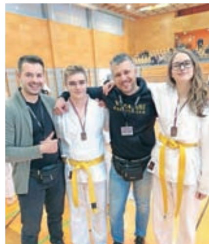
Tekmovalci in trenerji so bili zadovoljni z nastopom v Kopru.